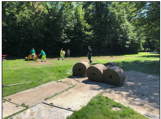
Verlegung des Rollrasen