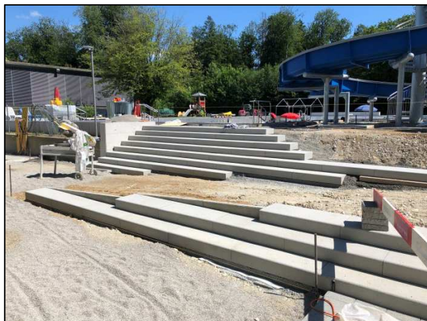
Bau der neuen Treppenanlage