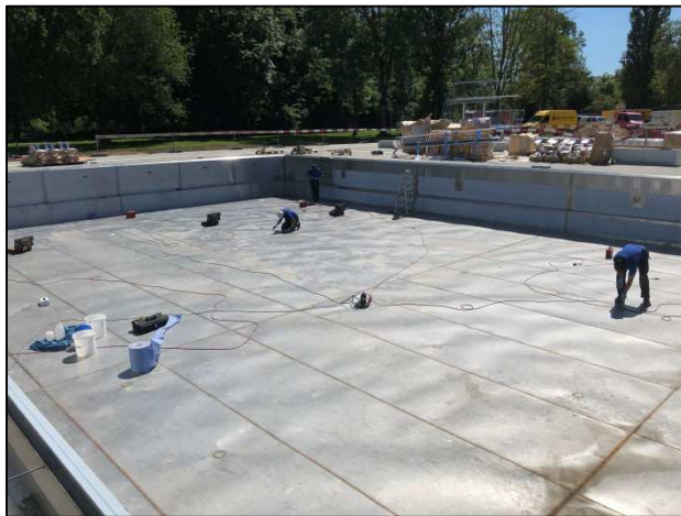
Die Schweissnähte werden gereinigt (elopoliert)

Wir werden uns mit einem letzten Newsletter zum Thema melden, sobald alle wichtigen Termine definitiv bestätigt sind.